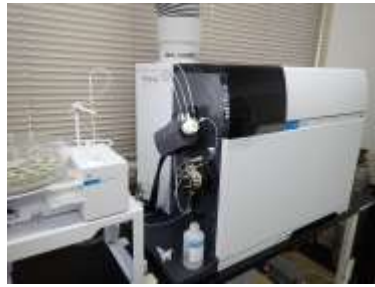
誘導結合プラズマ質量分析計 (金属類の測定)