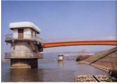
鹿又取水場 1号取水塔（旧北上川）