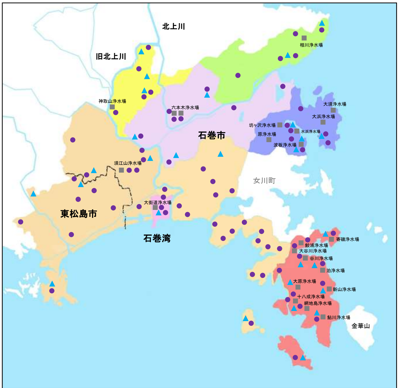
図 配水系統と検査地点略図