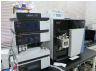
液体クロマトグラフ質量分析計 (有機物の測定)

国（厚生労働省）等で行う外部精度管理へ積極的に参加し、また自己精度管理の実施などにより、検査精度の向上と信頼性の確保に努めております。