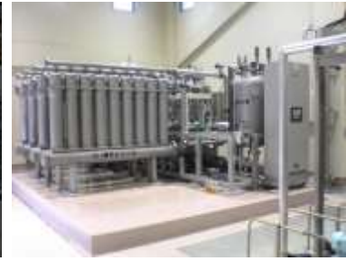
雄勝地区原浄水場膜ろ過装置