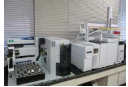
ガスクロマトグラフ質量分析計 (カビ臭物質の測定)