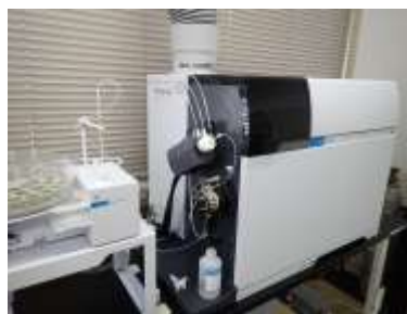
誘導結合プラズマ質量分析計 (金属類の測定)