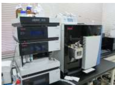
液体クロマトグラフ質量分析計 (有機物の測定)

国（厚生労働省）等で行う外部精度管理へ積極的に参加し、また、自己精度管理の実施などにより、検査精度の向上と信頼性の確保に努めております。