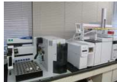
ガスクロマトグラフ質量分析計 (カビ臭物質の測定)