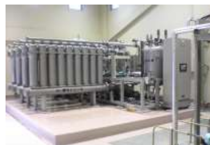
雄勝地区原浄水場