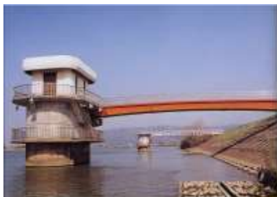
鹿又取水場 1号取水塔 (旧北上川)